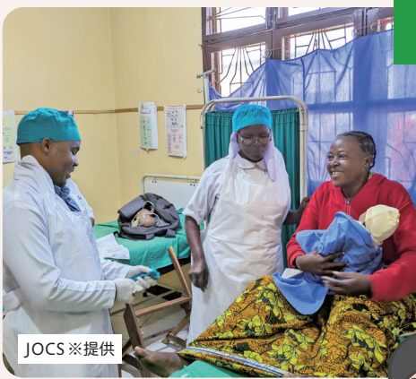
現地の人々や団体との協働