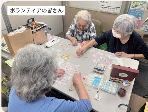
ボランティアの皆さん