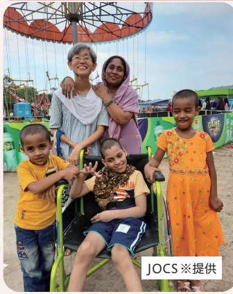
医療従事者を派遣