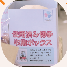
新聞店に設置された回収箱