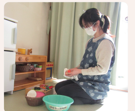
タオルを使っておもちゃの消毒