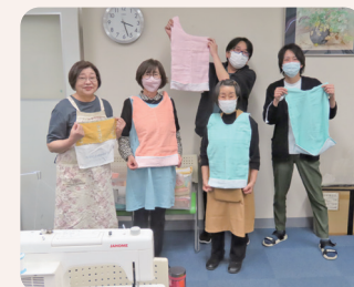
手作りの食用エプロンを必要な団体にプレゼント！