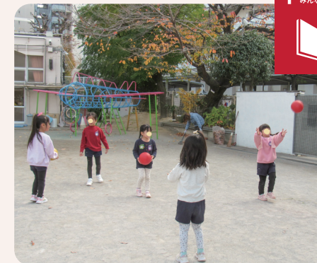
ベルマークで購入したボールで遊ぶ園児たち