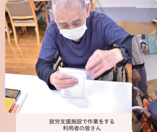
就労支援施設で作業をする利用者の皆さん