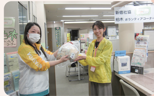
職場で集めた切手を窓口へ