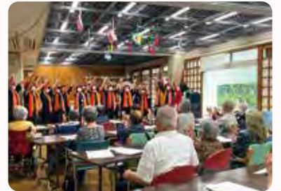
高齢者施設の皆さんと一緒に体を動かしています

助成金の相談に訪れた新宿社協分室でボランティア活動の提案があり、活動会員として登録しました。おかげで練習の成果を披露する場が広がりました。施設の皆さんを元気づけるつもりで出かけましたが、利用者の方が楽しそうに拍手をしたり歌ったりして喜んでくれる姿や、職員の方の温かさに触れて自分たちが元気をもらっています。