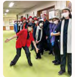
おそろいの衣装に身を包み出番を待つメンバーの皆さん

「地域ささえあい活動助成金」を申請することができると知り、新宿社協の団体会員になりました。グループ創立20周年は、助成金の交付を受け記念ライブを開催、地域の方にゴスペルを楽しんでいただくことができました。