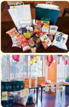
食品や日用品を配付