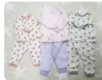
お送りしたパジャマ

区内の在宅重度障害児者、女性保護施設や乳児院の入所児者、交通遺児、自死遺児、そして、母子生活支援施設や児童養護施設を退所して間もない方へお見舞い品をお送りしています。