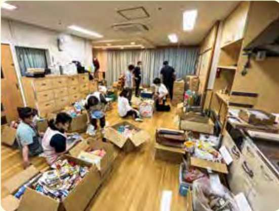
社福連参加法人による事前準備

地域への公益的な取り組みのため、区内に事業所または施設がある社会福祉法人が組織したネットワークです。