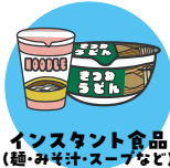
インスタント食品 (麺・みそ汁・スープなど)