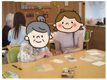
次回は若松町地区と落合第二地区です。

ボランティア募集情報はホームページに掲載しています。ボランティアに関するご相談は各窓口へお問合せください。新宿社協公式SNSもぜひ閲覧・ご登録ください。SNSはこちら▶