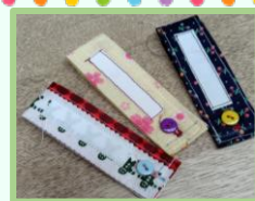
クリスマス会でプレゼントした お手製ネームタグ♪

毎回の活動にワクワクしています♪先輩ボランティアさんから学ぶことが多いのが二葉での活動の良いところです。