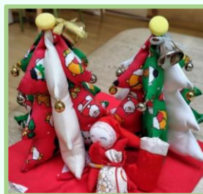
ツリーとサンタさん★

お子さんだけでなく「ママにも楽しんでもらいたい」と思い活動しています！ボランティア同士の出会いも嬉しいです♪