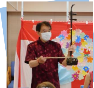
二胡は2本の弦の間に弓を挟み、音を奏でています。

ボランティア活動をしてみたい、ボランティアをしてほしいという方は、ぜひ新宿社協までお問い合わせください！