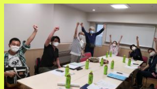
通いの場再開へ向けた打合せ