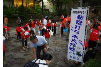
「打ち水大作戦2019」の様子

企業間の情報交換をはじめ、地域の交流イベントを住民の方々や施設・団体と企画・運営するなど、地域と連携・協働して取り組んでいます。