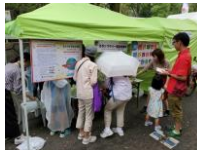
「ダイバーシティ・パーク in新宿2019」の様子

住民同士や施設・団体等との交流を目的とした地域のイベントの実施または参加・協力します。