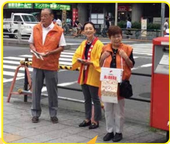
柏木地区民生委員・児童委員の皆さん 早朝の西新宿で今年初めて街頭募金を実施していただきました。

ご協力いただいた民生委員・児童委員の方々からは、実際に募金してもらうことは大変だという声をよくうかがいます。一方、街頭で募金に協力してくださる方と対面すると、共感してもらえたことがとてもうれしいとの声もたくさんいただきました。今年度も共感の輪を広げる活動へのご協力、ありがとうございました。