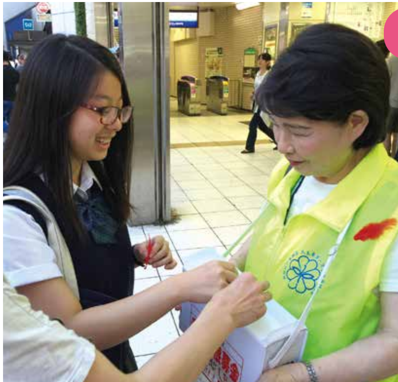
平成28年度共同募金運動の結果は、下記のとおりです。

社会福祉法人 新宿区社会福祉協議会 〒169-0075 新宿区高田馬場 1-17-20 電話:03-5273-2941(代表) FAX:03-5273-3082 Eメール:houjin@shinjuku-shakyo.jp http://www.shinjuku-shakyo.jp