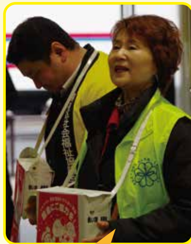
戸塚地区民生委員・児童委員の皆さん 人通りの多い高田馬場駅では、ひと際、大きな声で呼びかけていただきました。