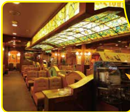
喫茶店「珈琲西武」さん 多くの人でにぎわう喫茶ホールに募金箱を設置していただいています。