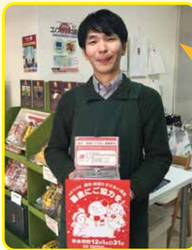
「コンフィデンス早稲田」さん 障害のある方の就労支援を行っており、新宿社協の助成金を活用したことをきっかけに、募金箱の設置に協力していただきました。

今年度も様々な民間団体が募金活動にご協力いただくことで、より多くの人たちへ募金の普及啓発ができました。