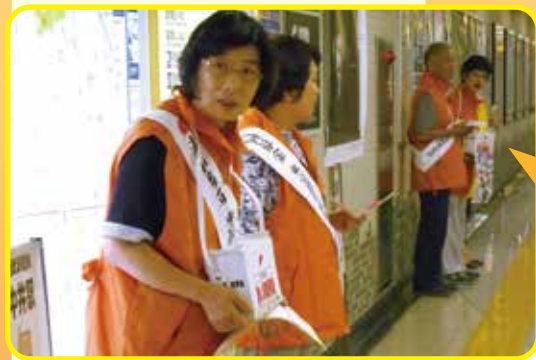
落合第一地区、落合第二地区民生委員・児童委員の皆さん 南北に長い都営中井駅の構内では、通行される方にご配慮いただきながら活動していただきました。