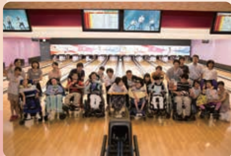
ボーリング大会へ参加