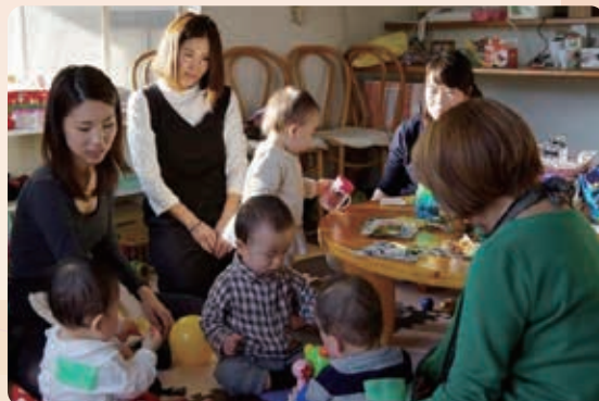
おもちゃ遊びの様子