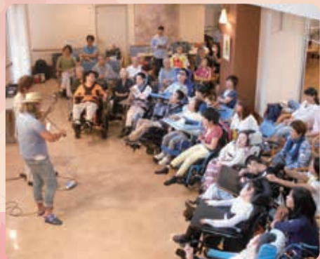
音楽演奏会の様子

当事者と支援者みんなでそれぞれの意見を出し、協力しながら、活動を通して育ちあいの機会を作っています。大学生など様々な支援者の方たちと共に楽しく学びあえる企画や創作活動を行っています。