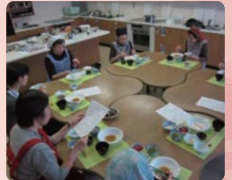
食事を囲んでの会食