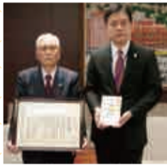
新宿、四谷、牛込、戸塚 各遊技場組合 様