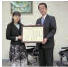
MS&AD ゆにぞんスマイルクラブ あいおいニッセイ同和損害調査株式会社 様