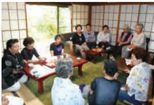
ふれあい・いきいきサロンの活動 (写真は、戸塚地区のいちょうサロン)