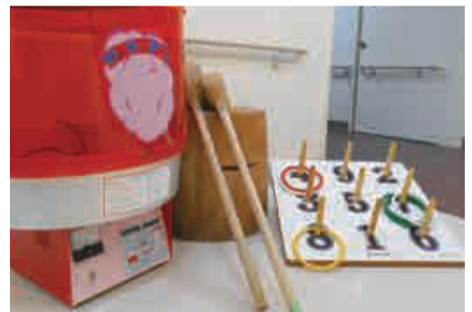
地域行用機材の貸出 (綿菓子機やもちつきセット、輪投げ等)