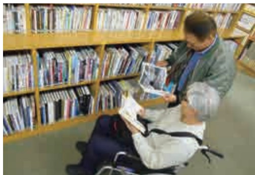
ちょこっと・暮らしのサポート事業 (図書館への外出支援の例)