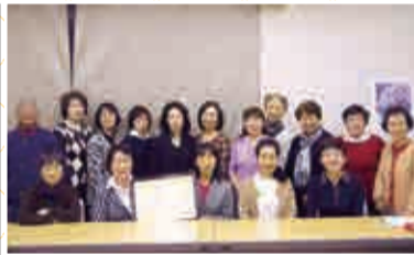
新宿区フォークダンス連盟 様

ご寄附いただいた物品の譲渡先からお礼のお手紙をいただきました。 この度は、大きなご協力をいただきましてありがとうございました。 譲渡いただいたバスタオル、タオル、石けん、肌着等は、区内外たくさんの更生保護施設・女性保護施設・児童施設の利用者にお渡しし、多くの方からお礼と喜びの声が届きました。本当にありがとうございました。 新宿区更生保護女性会 様