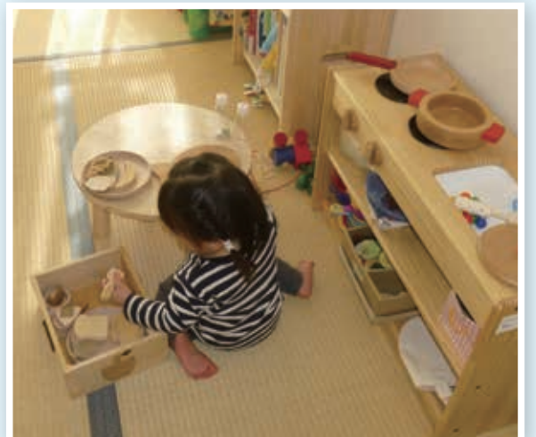
「木製の玩具は赤ちゃんも安心して手にとれます。」

これからも地域で安心、安全に子育てができるよう地域子育て支援の拠点として、地域のニーズを把握し、支援の質の向上に努めてまいります。何とぞよろしくお願い申し上げます。