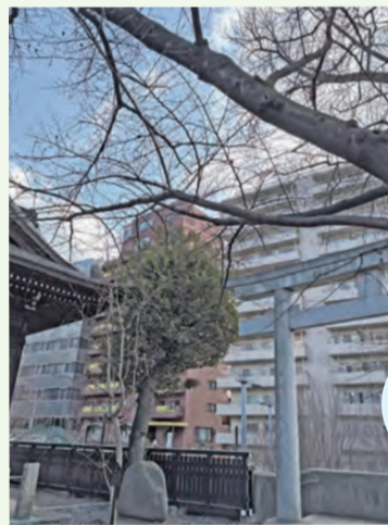
熊野神社から見た十二社通り西側

昭和43年に埋め立てられるまで、通りの西側には湧き水をたたえた十二社井天池がありました。