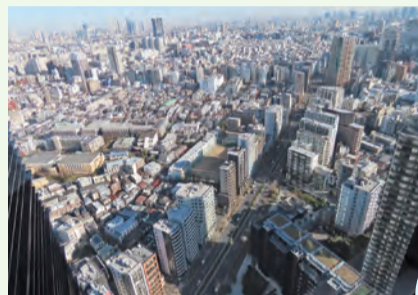
青梅街道沿い、西新宿8丁目の高層ビルから望む街並み