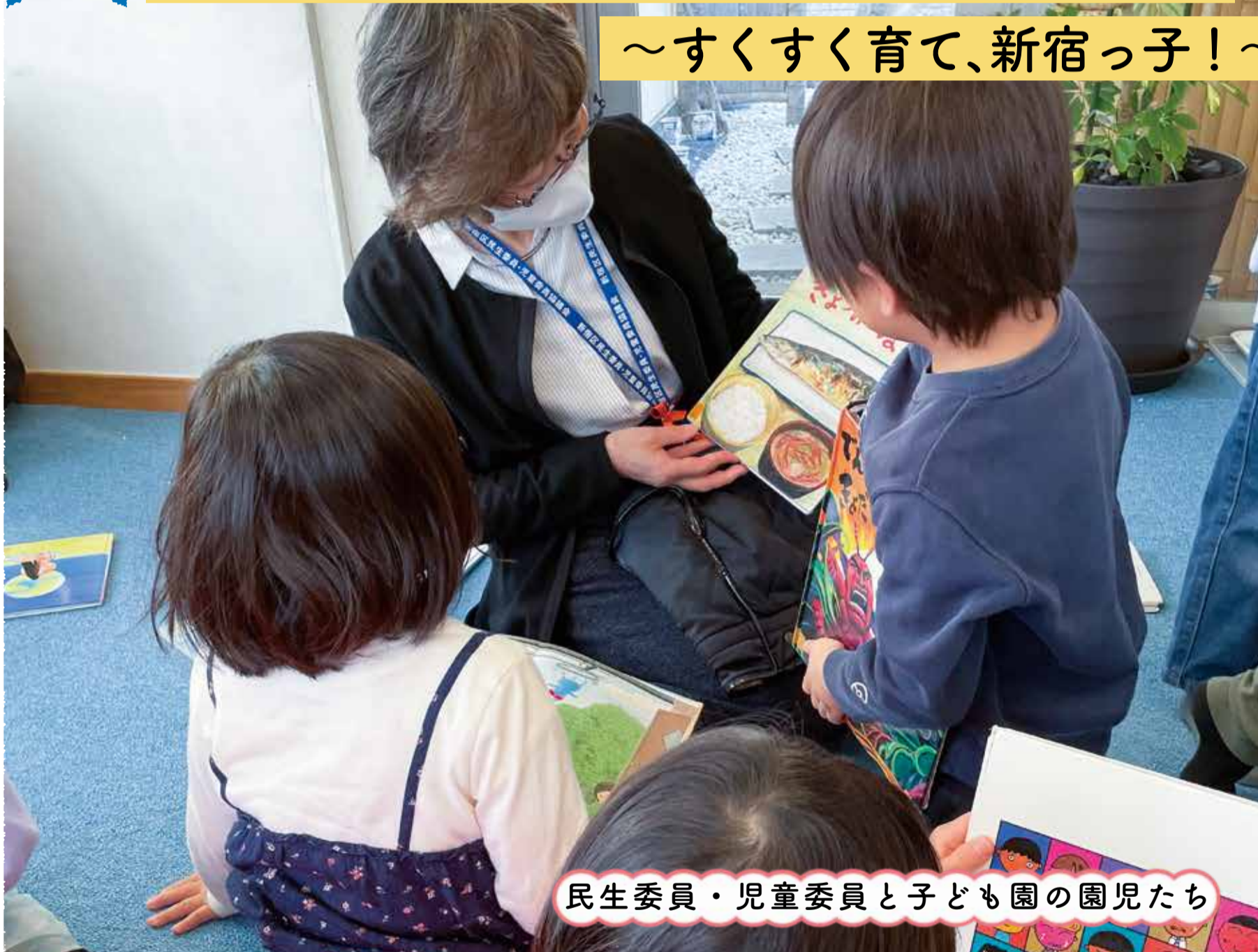
民生委員・児童委員と子ども園の園児たち