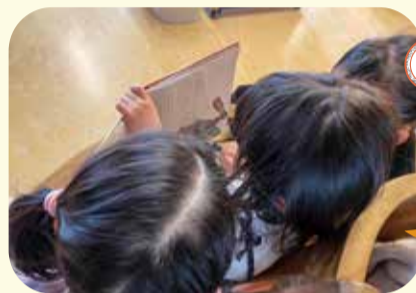
贈呈された本を読み聞かせあう園児たち

リクエストする本は子どもたちと一緒に考え、保育士が子どもの発達に必要なことを改めて考える機会になっています。とてもありがたい活動です。