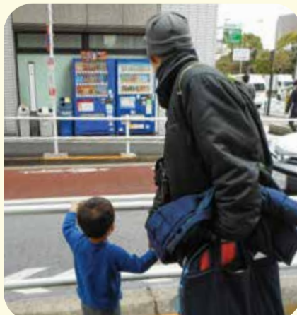
子どもの送迎をする提供会員

活動の原動力は「困っている人が近くにいるなら手を貸したい」、「子育て中に助けてもらいありがたかった。今度は助ける側になりたい」という支えあいの気持ちです。