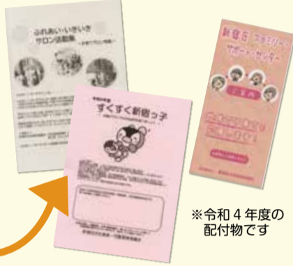
※令和4年度の配付物です

子どもから高齢者まで、どなたの相談にも応じ、 同じ住民の立場 で地域の福祉を考えます。