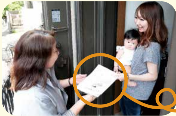
お子さんが生まれた家庭を訪問します

子どもから高齢者まで、どなたの相談にも応じ、 同じ住民の立場 で地域の福祉を考えます。