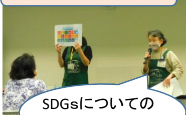
SDGsについてのお話もありました。

今回使用する段ボールのリサイクルシステムや、紙の分別について学び、紙は貴重な資源であることを再確認しました。