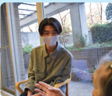
高齢者の話に耳を傾ける様子