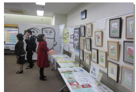
写真(上)講演『歌舞伎町まんぶく座』、(中央)物販ブース、(下)展示ブース