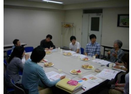
【写真】意見交換会風景

イベントから半年が経過した5月のとある日。元実行委員にお集まりいただき意見交換会を行いました。成年後見制度や障害者を取り巻く環境や問題点、展望など、成年後見制度だけではとどまらない、幅広い意見が飛び交いました。ほんの一部ですが、ご紹介させていただきます。